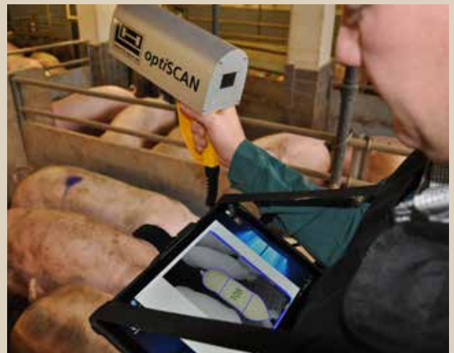
optiSCAN schnelle und genaue Vermessung von Mastschweinen

Seit 50 Jahren baut das Familienunternehmen Hölscher + Leuschner Ställe mit ausgefeilter und ausgereifter Technik. Als anerkannter Spezialist entwickelt und produziert H+L alles im eigenen Haus. Im Fokus steht stets größtmögliche Tiergesundheit, artgerechte Haltung, verbunden mit Arbeitersparnis und Ertragssteigerung für den Landwirt.